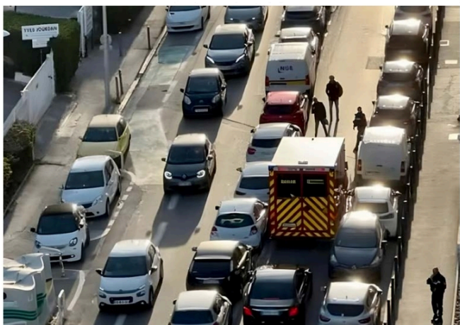
Un véhicule d'urgence est bloqué sur le boulevard Barral, en marge d'un match.