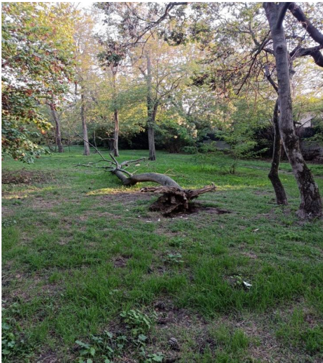
parc Henri Fabre