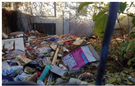
transformateur EDF (Cdt Rolland - Rivet)