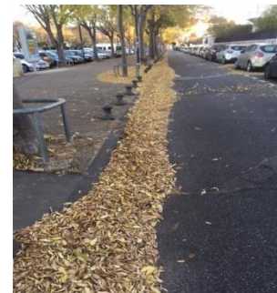
boulevard de Gabès

Ces photos font douter de l'efficacité du service fait par les cantonniers. Avec la sécheresse, les feuilles sont tombées précocement et s'accumulent depuis au gré du vent. Doit-on attendre le mois de février, dernière chute des feuilles, pour les faire ramasser ? Avec la pluie, attention