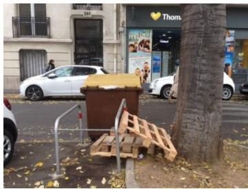
Avenue du Prado