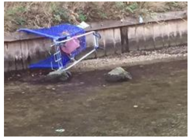
caddie - bord de l'Huveaune

Il n'est pas normal d'utiliser les rues pour y déposer table, matelas, sommier, réfrigérateur... L'incivisme est latent, il est vrai, mais parfois le service appelé pour l'enlèvement des objets ne vient pas à la date fixée pour le rendez-vous.