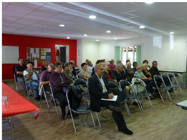
Le début de la réunion.